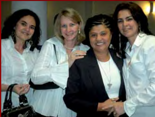
o público presente.