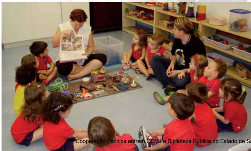
Cooperação Técnica entre o CEMJ e Biblioteca Pública do Estado de Santa Catarina