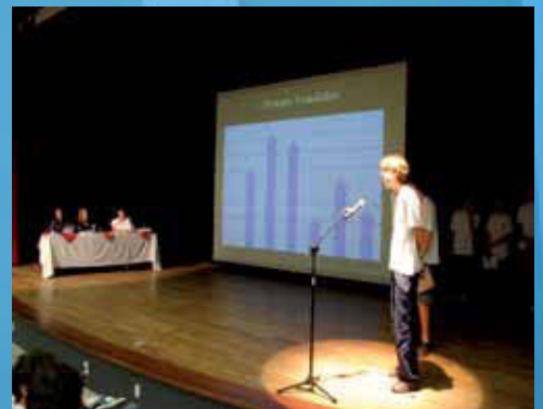
Cooperação Técnica entre o CEMJ e Biblioteca Pública do Estado de Santa Catarina