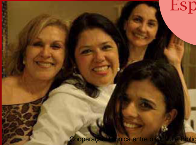
Cooperação Técnica entre o CEMJ e Biblioteca Pública do Estado de Mato Grosso do Sul