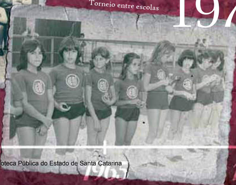
Foto dos alunos