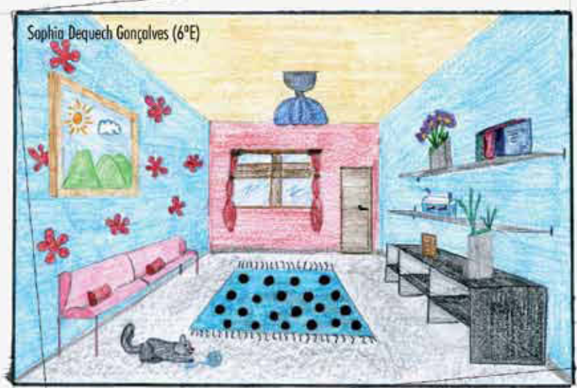
Sophia Dequech Gonçalves (6ºE)