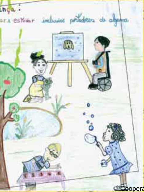
... para incluir todos os participantes de alguma...